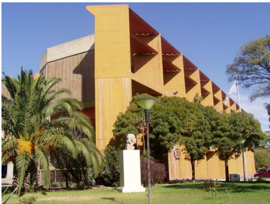
Cámara de Diputados de La Pampa

Naturalizado: extranjero que adquiere los derechos naturales de un país.