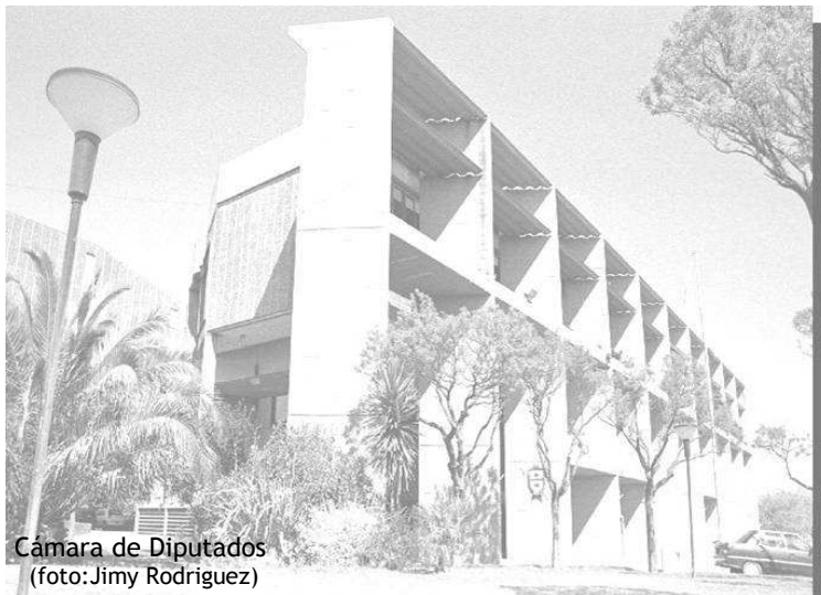
Cámara de Diputados