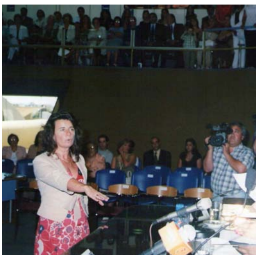
Diputados provinciales prestando juramento

Compeler: impulsar, estimular, coaccionar