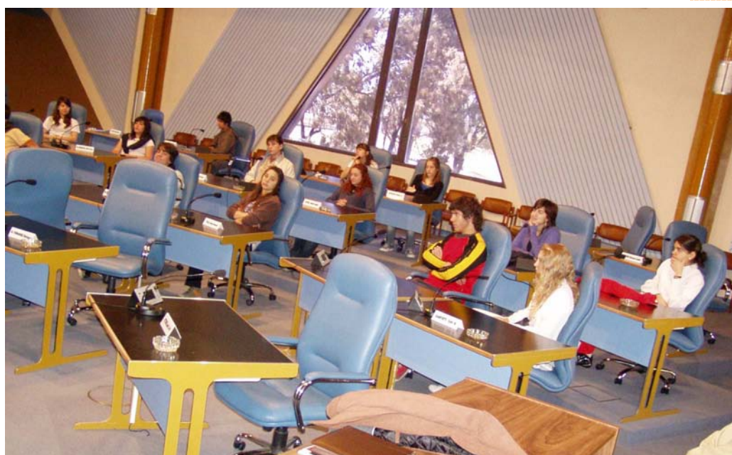
Visita de alumnos a la Cámara de Diputados-Programa Educación para la Democracia

Los términos a que se refiere el presente artículo se computarán por días hábiles.