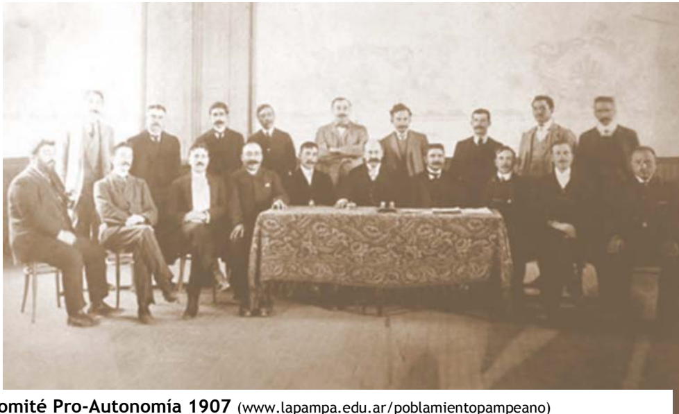
Comité Pro-Autonomía 1907 ( www.lapampa.edu.ar/poblamientoampeano )

Es así como el 20 de julio de 1951, se sanciona la ley 14037, en donde se declaran provincias a la actual Provincia de La Pampa y Chaco.(1)