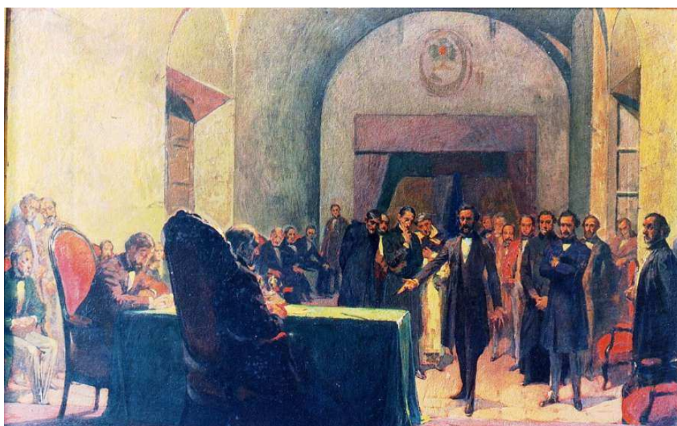
EL CUADRO "LOS CONSTITUYENTES DEL '53 "SU AUTOR: ANTONIO ALICE

Es uno de los cuadros más importante que se haya pintado en el país sobre un hecho histórico, y el más grande pintado a caballete en esa época. Para esta obra, Alice realizó cerca de 100 bocetos, visitando en el interior del país a los familiares de los próceres; buscando elementos (dibujos, óleos, daguerretipos, fotos) para poder realizarla. La obra mide 5,50 metros de alto, por 3,60 metros de ancho y la comenzó en 1922. ( www.kalipedia.com/historia-argentina )