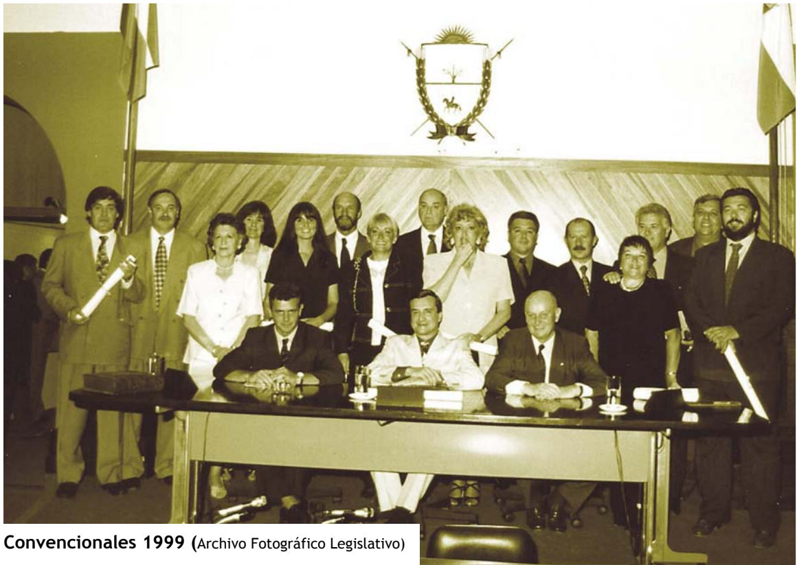
Convencionales 1999