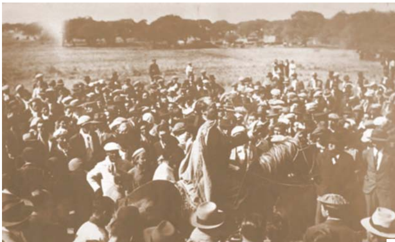
Vanguardia Provincialista de la UCR de Toay 1935 ( www.lapampa.edu.ar/poblamientoampeano )