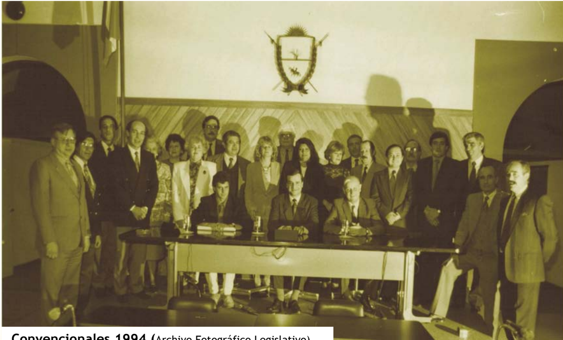
Convencionales 1994