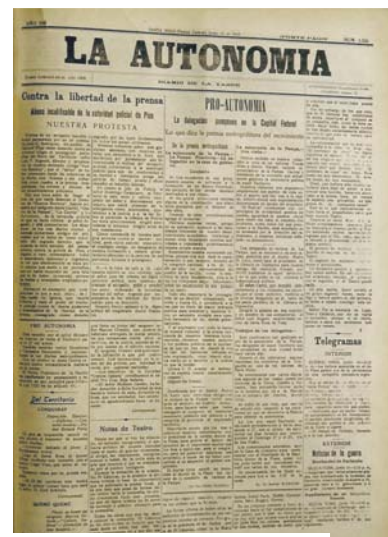
Diario La Autonomía