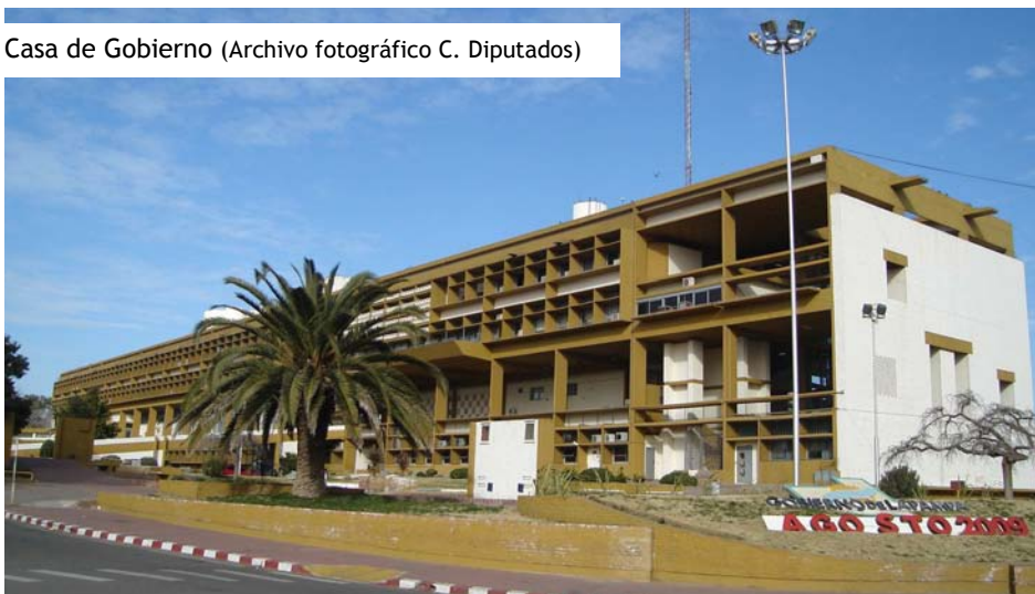
Casa de Gobierno

Argentino nativo o por opción: Nativo es el nacido en el lugar de que se trata; opción es el derecho que tienen los que poseen doble ciudadanía a elegir una de ellas.