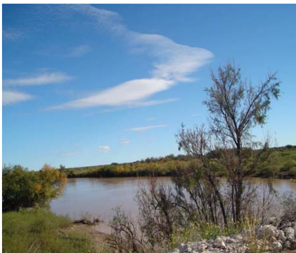
Río salado

Código de Aguas: Ley N° 607, sancionada el 05-09-1974