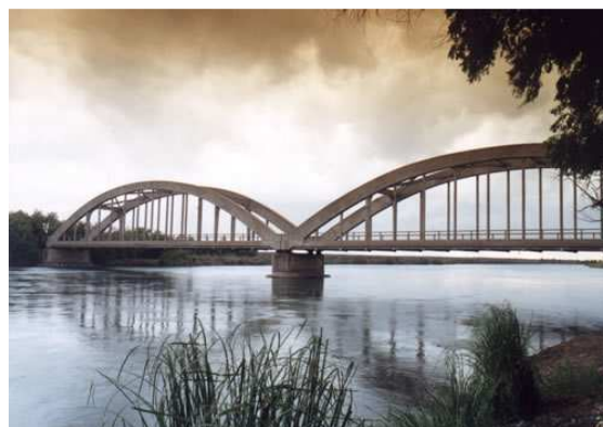
Puente sobre el Río Colorado-2002