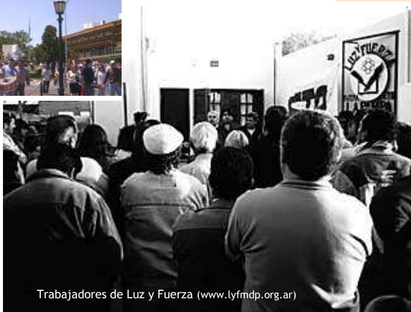
Trabajadores de Luz y Fuerza ( www.lyfmdp.org.ar )