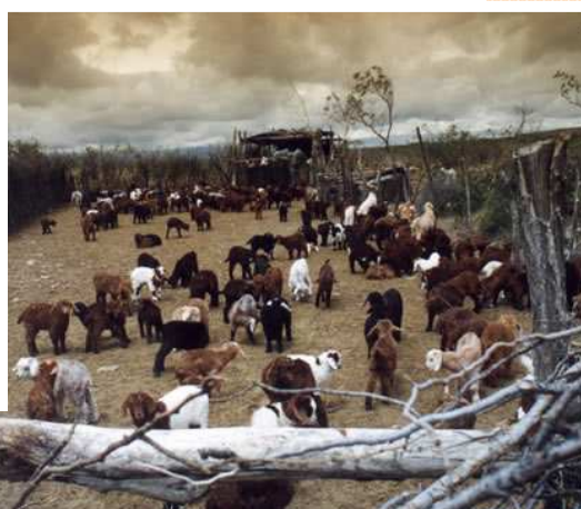
Criadero de chivitos en el oeste pampeano-2002