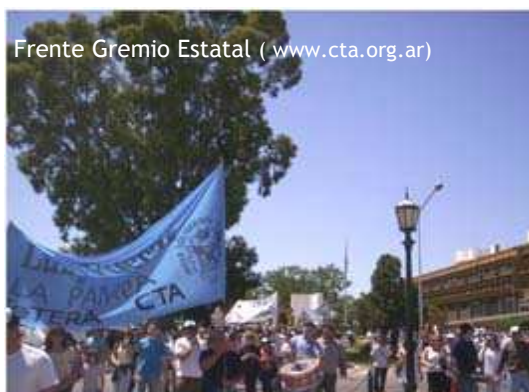
Frente Gremio Estatal ( www.cta.org.ar )

Artículo 48°.- Para la solución de los conflictos individuales o colectivos del trabajo, la Provincia creará organismos de conciliación y arbitraje y el fuero laboral en la justicia letrada. En todos los casos el procedimiento será sumario, asegurando al trabajador el patrocinio letrado gratuito y la exención de impuestos y tasas judiciales.